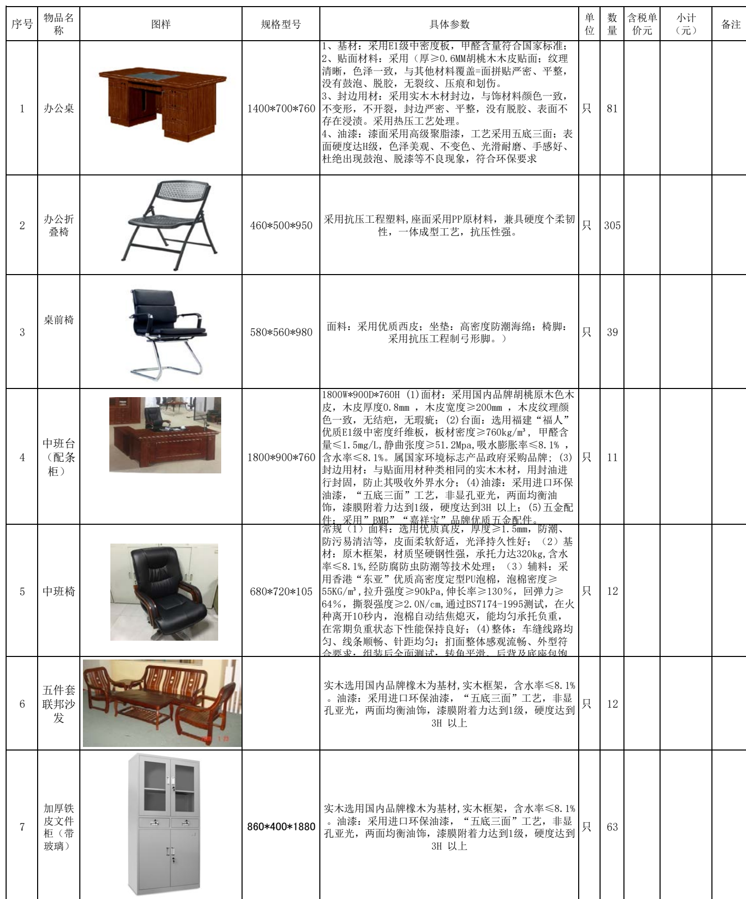
汕头职业技术学院2020年办公家具采购询价表